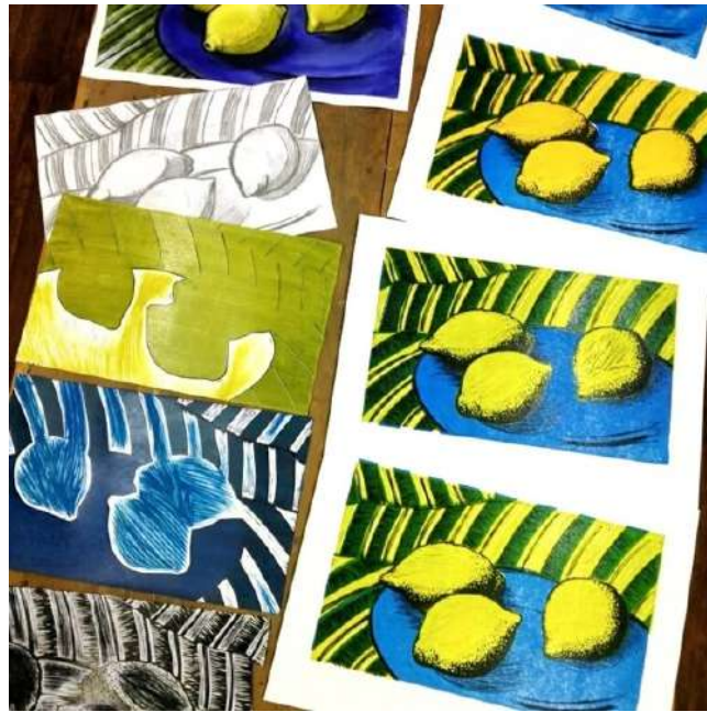
Рисунок 3 – Печать в три доски