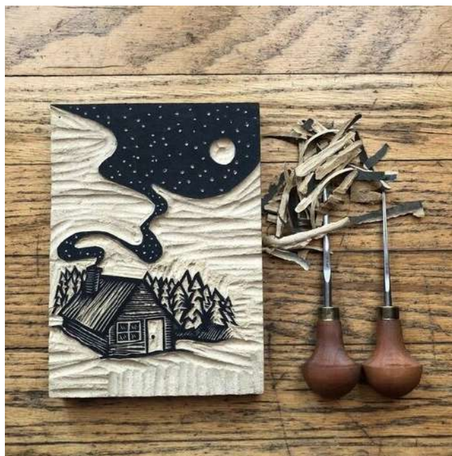
Рисунок 3 – Пример готовой печатной формы

нажатия руки на резец. Даже при лёгком изменении нажима изменяется толщина линии. При гравировке как прямых, так и кривых линий рука с резцом должна двигаться только в одном направлении, не отклоняясь ни влево, ни вправо.