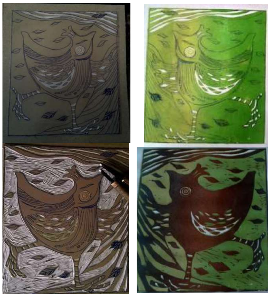
Рисунок 2 – Печать методом одной доски

Метод печати в две и более доски отличается возможностью повторного воспроизведения любого из этапов нанесения тональных слоёв, однако он более ресурсозатратен (рисунок 3). Здесь подготавливается нужное количество кусков линолеума для печати одного изображения, где каждый из них соответствует своему тональному слою в соответствии с эскизом. Также, как и методом одной доски, гравюра печатается от самого светлого тона к самому тёмному на одном листе бумаги, но используя для каждого слоя своё клише.