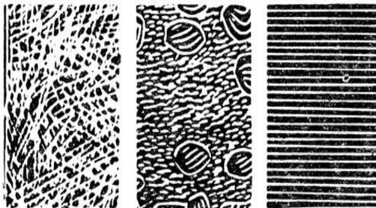
Рисунок 2 – Образцы штрихов в линогравюре

Эскиз - это поиск наилучших вариантов графических решений натюрморта, пейзажа, жанровой картины, а так же учебных постановок. Техники работы над наброском включают различные линии, штрихи, пятновые удары и заливки кистью (рисунок 2).