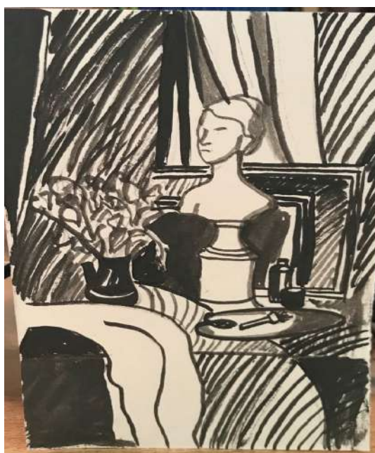
Рисунок 3 – Образец эскиза линогравюры

Рисунок, выполненный под печатный графический лист должен по возможности полностью имитировать печатное изображение. Это требует тщательной подготовки и детальной работы над композицией, тональностью и пластикой изображения (рисунок 3).