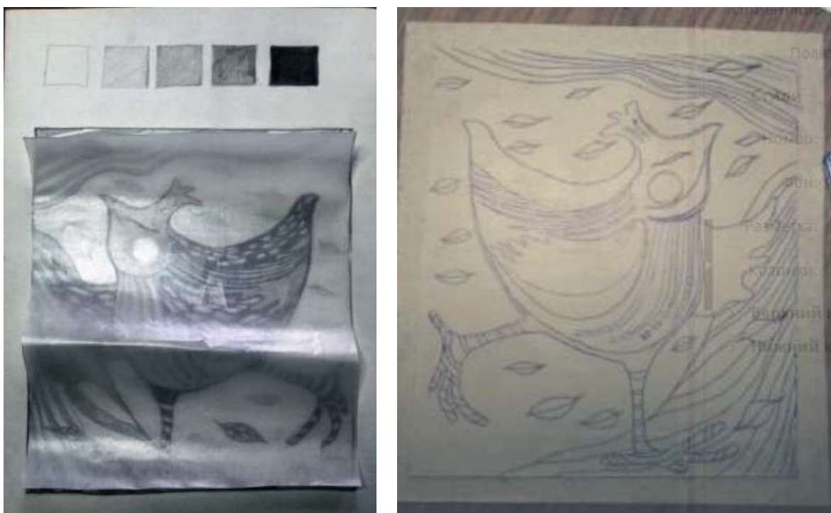
Рисунок 1 – Процесс переноса эскиза на линолеум