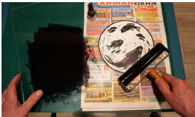
Рисунок 5 – Накатывание формы

2. Валиком переносят краску на линолеум, прокатывая несколько раз по его поверхности (рисунок 5).