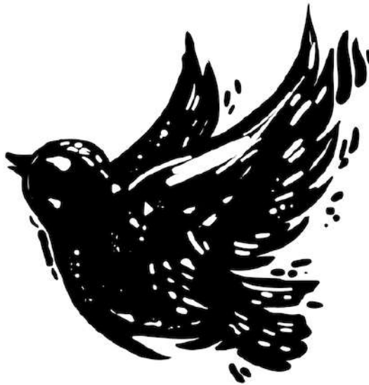
Рисунок 5 – Образец тонального эскиза

Следующим шагом становится перевод линейного эскиза в тональный. Разбиваем изображение на два тона, белый и чёрный с помощью одноцветного маркера, разделяя изображение на свет и тень, имитируя штриховкой полутона (рисунок 5).