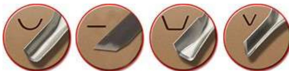
Рисунок 2 – Разновидности резцов

После того как на линолеуме при помощи копировальной бумаги перенесён рисунок, продолжают резьбу в определённой последовательности (рисунок 3). Сначала вырезаются большие участки, заранее определённые в эскизе (при печати они будут смотреться большими белыми поверхностями). Характер резьбы зависит от