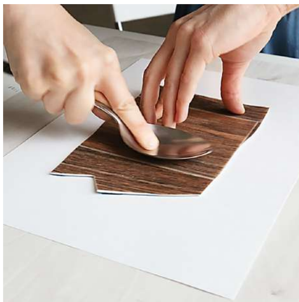
Рисунок 4 – Печать ложкой

Бумага. Для печати подойдет любая бумага плотностью не меньше 160 г/кв.м, в том числе и картон. Очень интересные отпечатки получаются на цветной (тонирующей) бумаге. Линогравюру можно печатать также на ткани и дереве.