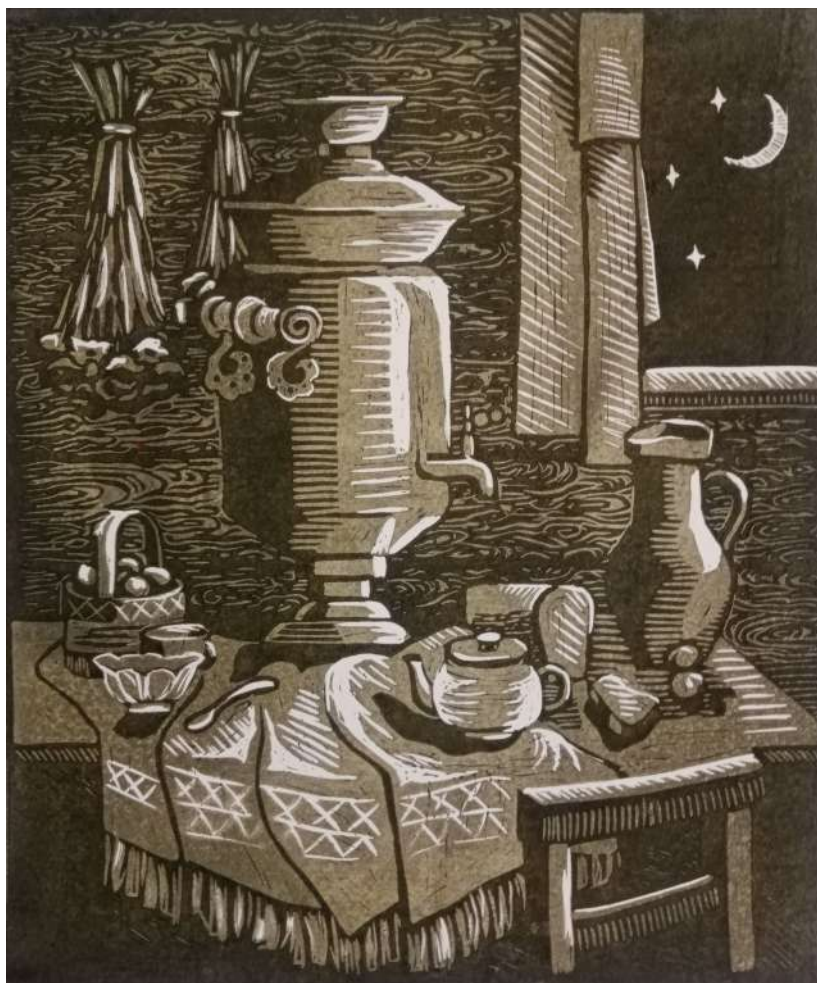
Рисунок 1 – Пример готового графического листа

Линогравюра – техника высокой печати, сходная с ксилографией. Изображение вырезается на линолеуме или другой полимерной основе и отпечатывается на лист бумаги. Впервые эта техника появилась в начале XX века, когда художники попробовали использовать для печати больших плакатов линолеум вместо деревянной доски.